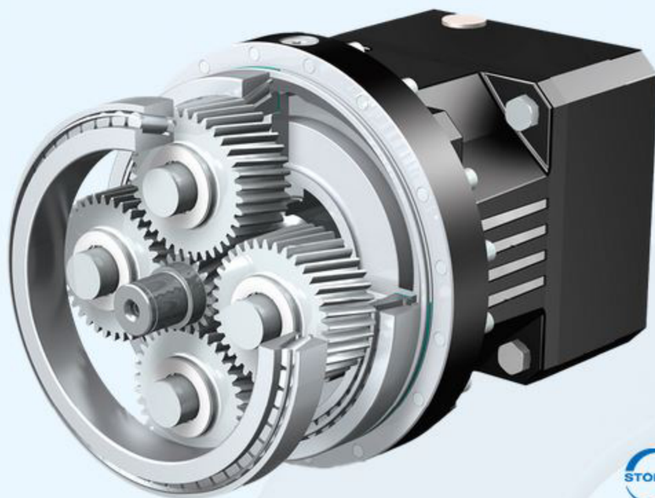
Planetová převodovka ServoFit® PHQ 10, 2 stupňový systém Quattro s motorovým adaptérem ME a motorovou spojkou EasyAdapt®